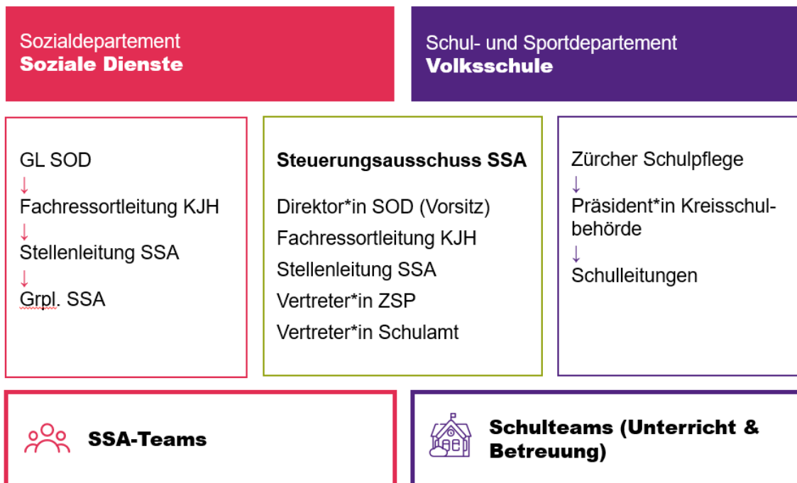
Abbildung 1: Institutionelle Vernetzung der SSA

Die institutionelle Vernetzung der SSA sowie die interdisziplinäre Zusammenarbeit der Schulsozialarbeiter*innen mit weiteren Akteur*innen ist ein wichtiger Bestandteil der Leistungserbringung. Die institutionelle Vernetzung der SSA innerhalb der beiden Departemente erfolgt auf verschiedenen Ebenen (siehe Abbildung 1).